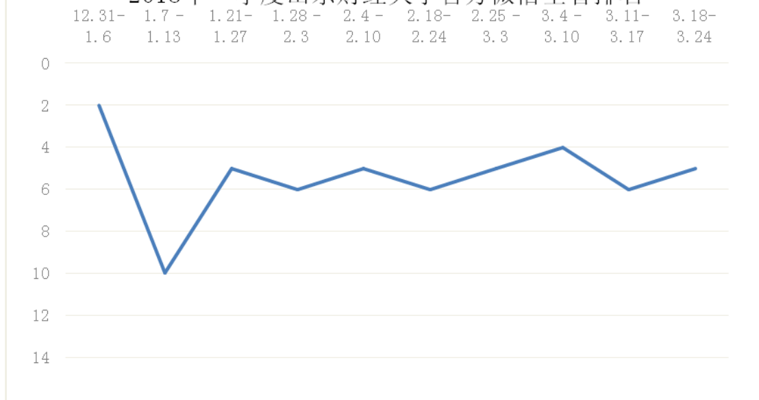
2018年一季度山东财经大学官方微信全省排名

2018年第一季度，官方微信在全国高校微信影响力排行榜中八周进入百强行列，WCI指数为691.90，最高排名全省第二。本季度共推送67次，计68篇。